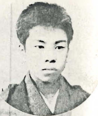
少年時代の筆者（十六歳）