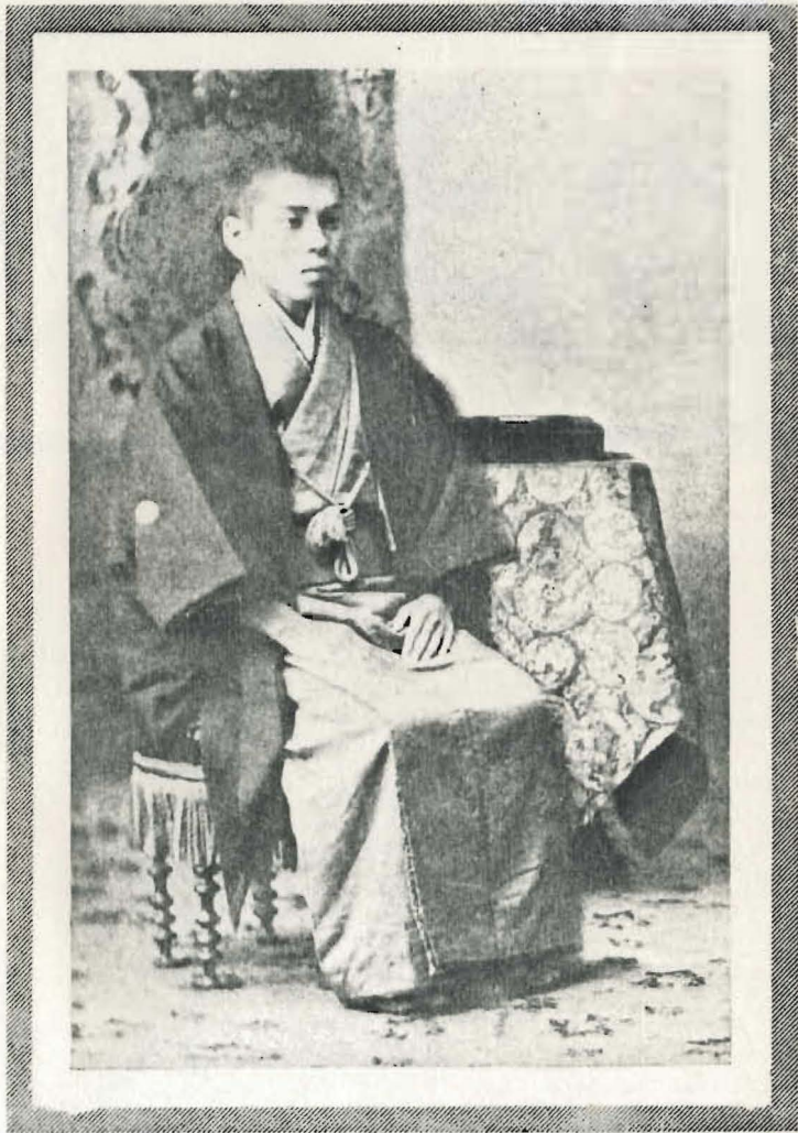
（歳五十二） 影 面 の 者 筆